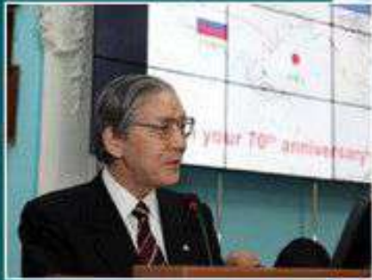
Президент Медицинского университета г. Канадзава (Япония) профессор С. Катсуда