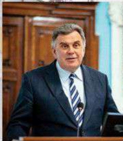
Губернатор Ярославской области С.Н. Ястребов