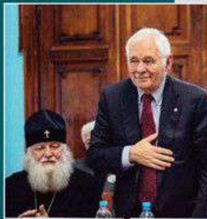
Митрополит Ярославский и Ростовский Пантелеймон и Президент Национальной медицинской палаты профессор Л.М. Рошаль

Группе сотрудников в торжественной атмосфере вручены почетные знаки «Отличник здравоохранения», ведомственные награды Министерства образования и науки РФ, Грамоты Губернатора и Государственной Думы Ярославской области.