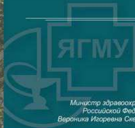
Министр здравоохранения Российской Федерации Вероника Игоревна Скворцова