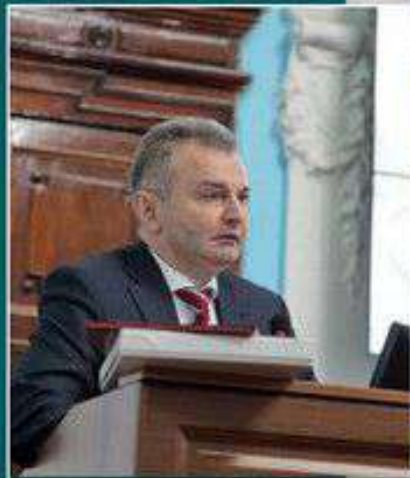
Первый заместитель Министра здравоохранения Российской Федерации И.Н. Каграманян