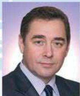
Проректор по научной работе, доктор медицинских наук, профессор