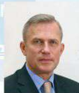
Проректор по учебной и воспитательной работе; доктор медицинских наук, профессор