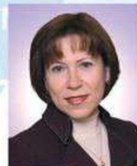
Декан фармацевтического факультета, доктор фармацевтических наук, доцент