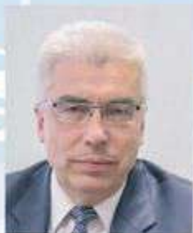
Декан лечебного факультета, кандидат медицинских наук, доцент