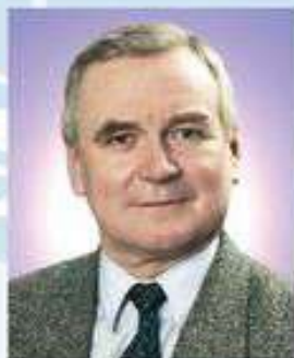
Декан педиатрического факультета, заслуженный врач РФ, кандидат медицинских наук, доцент