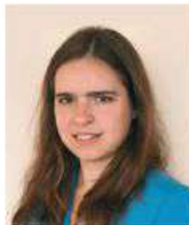
Начальник учебно-методического управления, доктор медицинских наук, доцент