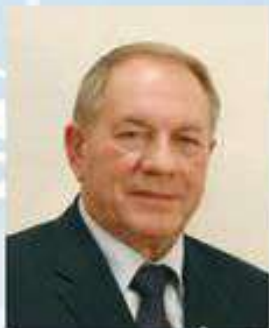
Президент университета, академик РАН, доктор медицинских наук, профессор